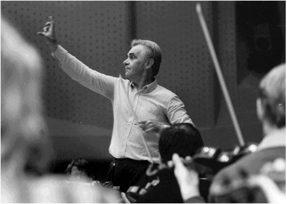
Igor Bezrodny Turu Filharmooniaorkestri ees

Bezrodny oli nõutud žüriiliige paljudel rahvusvahelistel konkurssidel nagu Tšaikovski, Sibeliuse, Wieniawski, Tokio, Montreali jt konkursid. Pedagoogina alustas Bezrodny tööd Moskva Konservatooriumis 1955. aastal. 1970. aastast oli ta professor, aastatel 1979–1990 viiulikateedri juhataja ning aastatel 1990–1997 Sibeliuse Akadeemia professor Helsingis. Prof Bezrodny on üles kasvatanud rohkem kui ühe põlvkonna tuntud viuldajaid. Tema õpilased olid ja on mängimas üle terve maailma sellistes orkestrites nagu New Yorgi Filharmoonikud, Berliini Filharmoonikud, Leipzigi Gewandhaus-orkester jt. Tuntud nimekad solistid on Dmitri Sitkovetski, Maxim Fedotov ja Pavel Berman.